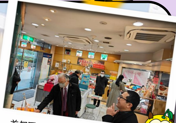
首都圏アンテナショップ視察の様子